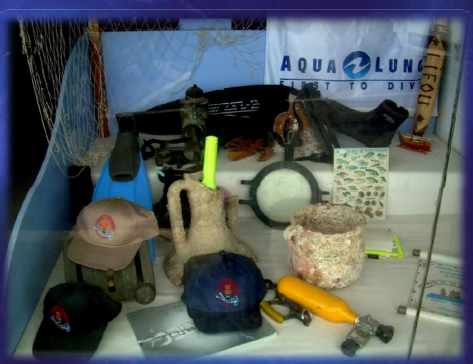
Port de la Selva, Spain 2009