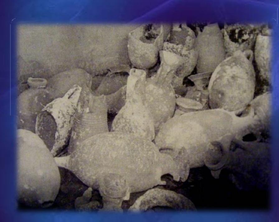
Spain, '50, '60